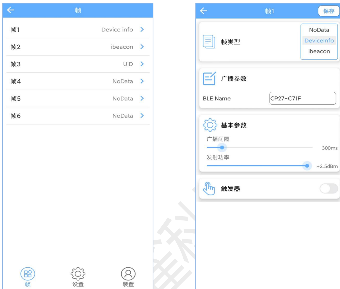
图 2： 安卓 APP 界面图